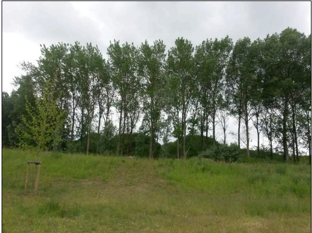
Figuur 2.4 Jonge populieren nabij de geplande turbinelocaties in het noordoostelijke deel van het plangebied