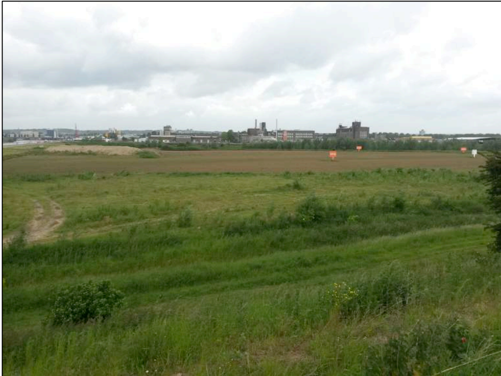
Figuur 2.2 Impressie van het zuidelijke deel van het plangebied