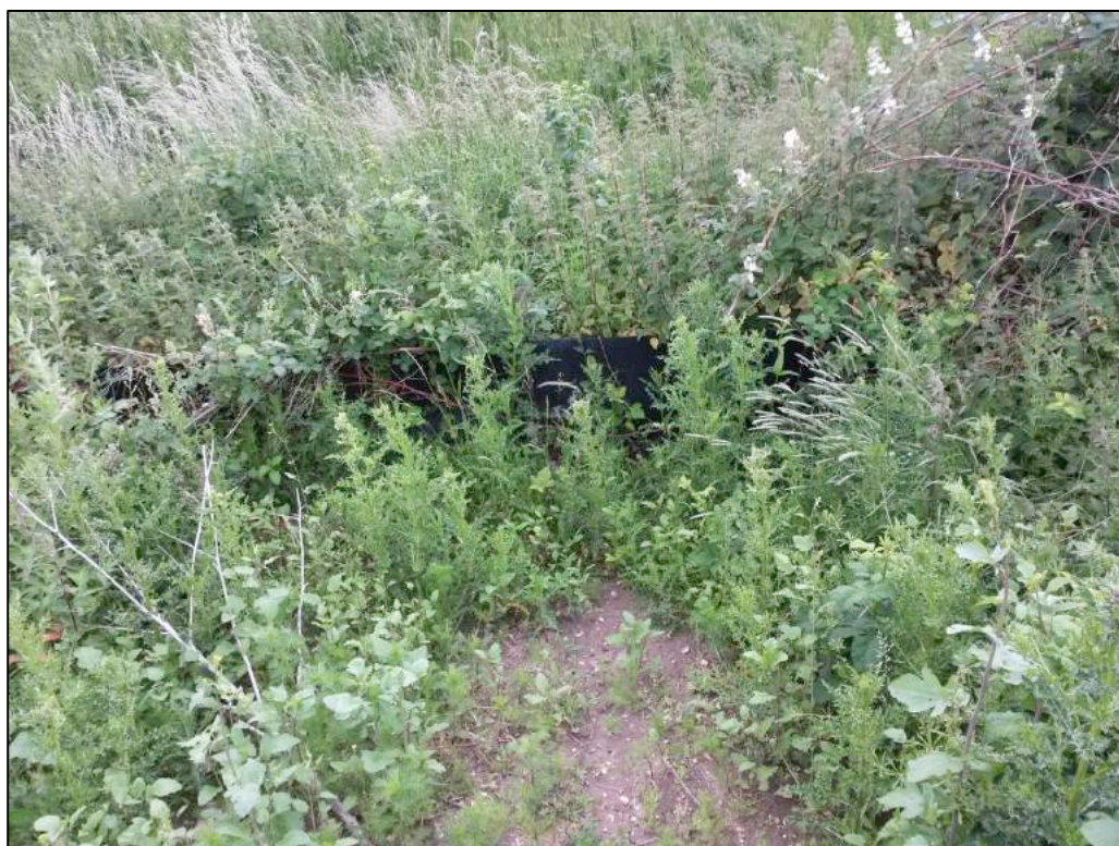
Figuur 5.2 Foto deels verzakt en overwoekerd paddenscherm in westelijk deel plangebied

De werkzaamheden dienen buiten de meest kwetsbare periode van overwintering plaats te vinden, dus buiten de periode oktober - april. Is dit echter niet mogelijk, bijvoorbeeld door tevens te willen werken buiten het broedseizoen van vogels, dan dient voorafgaand aan de overwinteringsperiode het projectgebied ontoegankelijk gemaakt worden voor rugstreepadden door het plaatsen van paddenschermen. Dit is voorheen ook al gedaan, getuige een deels verzakt en overwoekerd paddenscherm dat tijdens het veldbezoek is aangetroffen ter hoogte van de droge greppel parallel aan de Pleijweg (zie figuur 5.2).