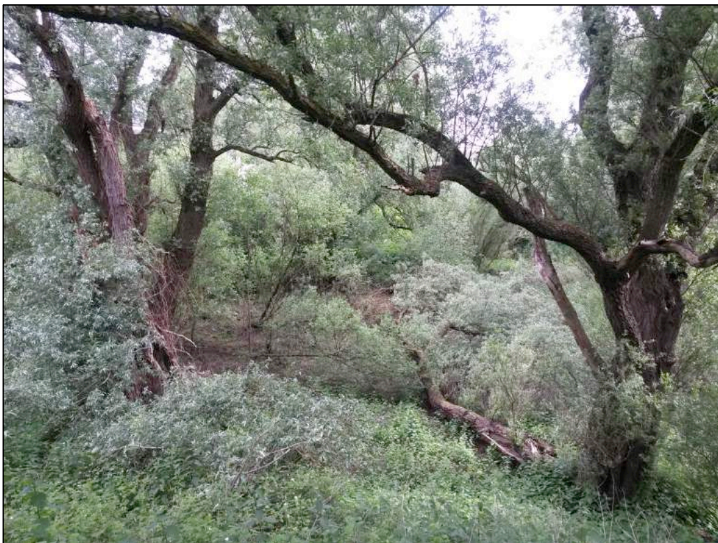
Figuur 2.3 Oude wilgen in een overblijfsel van een oude take van IJssel in het plangebied