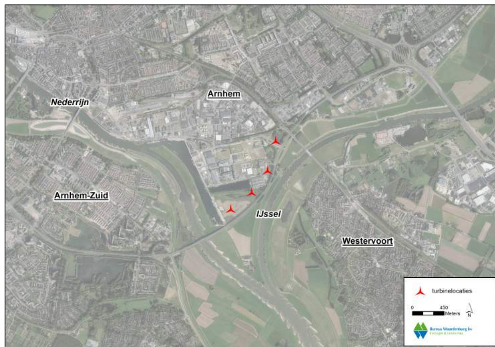
Figuur 2.1 Locaties van de vier geplande windturbines (rode cirkels) langs de Pleijweg in de gemeente Arnhem.

De twee noordoostelijke turbines zijn gepland langs het industrieterrein Kleefse Waard. Tussen dit industrieterrein en de Pleijweg staat een smalle groene strook, voornamelijk bestaande uit jonge populieren (zie figuur 2.4). Het industrieterrein is 's nachts verlicht en vormt als zodanig een dominante lichtbron op korte afstand.